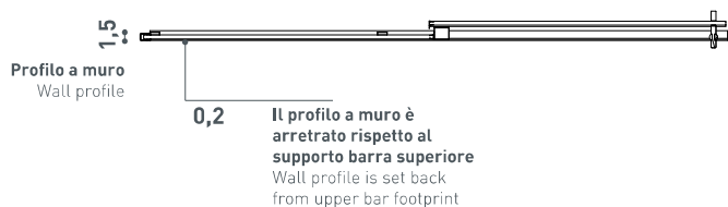
Sezione a 100 cm Section at 100 cm