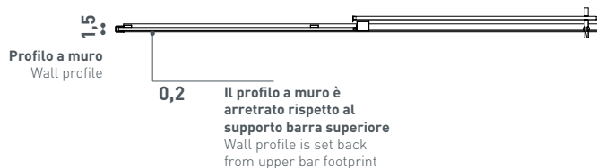
Sezione a 100 cm Section at 100 cm