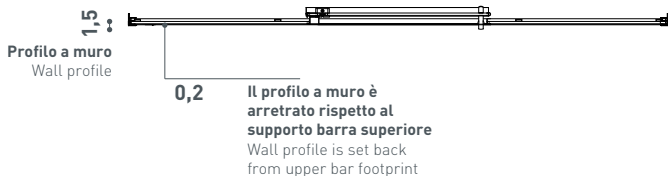
Sezione a 100 cm Section at 100 cm