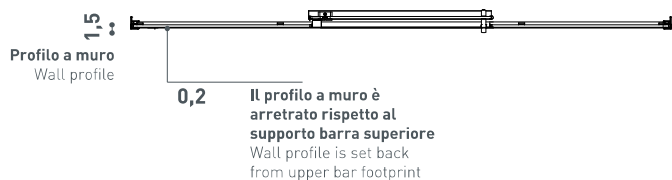
Sezione a 100 cm Section at 100 cm